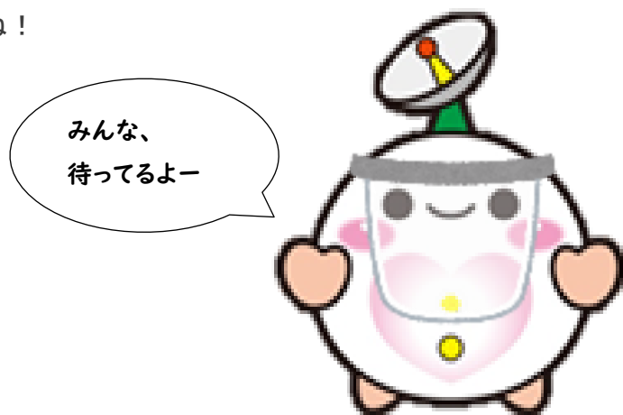
多摩ボラセンキャラクター タマボラ君

また、「ボランティア通信 7月号」( http://tamavc.jp/site/article/Vtsuusin202107 )では、「夏のリモボラ体験」以外にリサイクルボランティア、折り鶴ボランティアなどもご紹介！ ぜひ見てね！