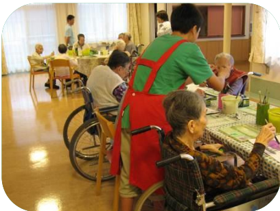
高齢者施設でぬり絵などレクリエーション活動のお手伝いを週1回、交代で行っています。