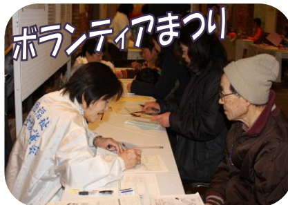
毎年 4000 名が来場するボランティアまつりでは、多くのボランティア団体や企業・事業所などがスキルを活かした催しを行っています。