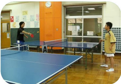
児童館に来館する子どもたち達と遊んだり、行事や館内整理のお手伝いをします。