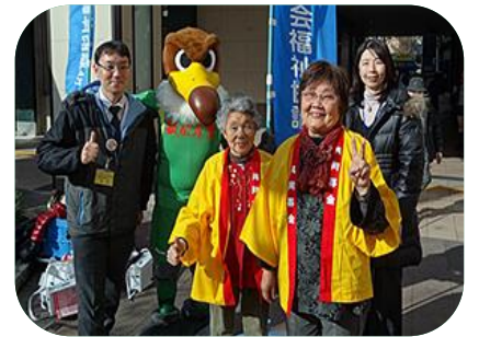
多摩市社会福祉協議会の「歳末たすけあい運動街頭募金」に、東京ヴェルディからヴェルディ君も応援に来てくれました。