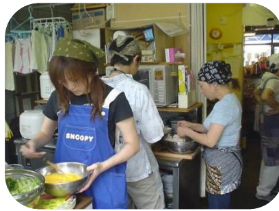
高齢者を中心とした交流の場で、食事作りの補助や話し相手などを行っています。